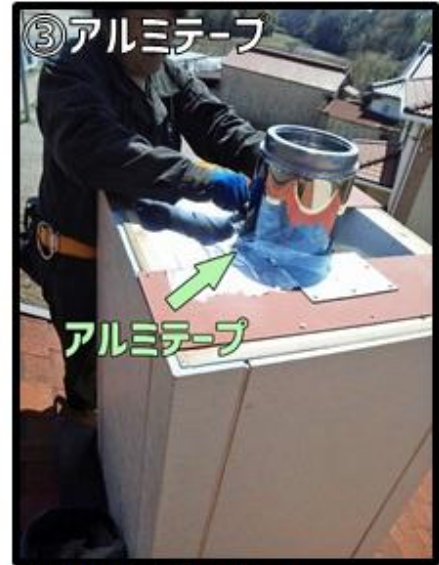
③アルミテープを貼ります。