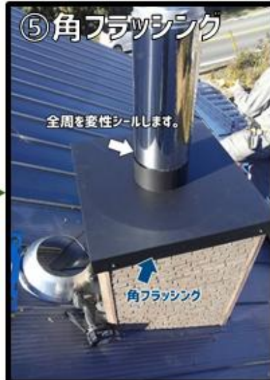
⑤角フラッシングを被せます。この時煙突との接点を変性シールします。