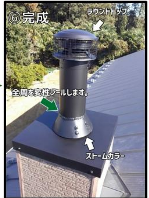
⑥スチームカラーを被せ、煙突との接点を変性シールします。ラウンドトップを取り付けて完成です。