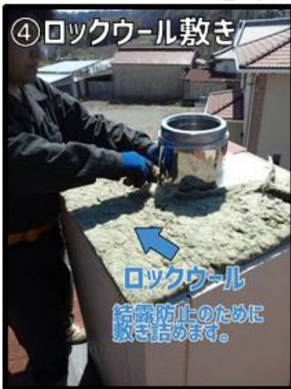
④結露防止のためにロックウールを敷き詰めます。