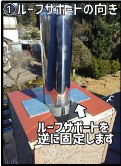
①ルーフサポートの向きは逆に固定します。