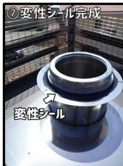
⑦変性シール完成図です。