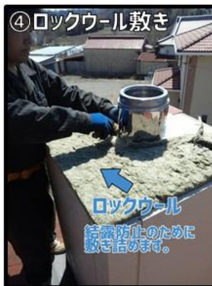
④ロックウールを敷き詰めます。