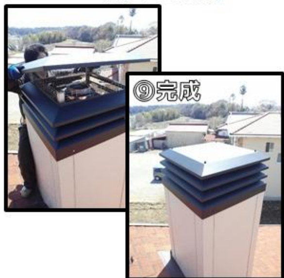
⑨角トップの蓋を被せ、固定して完成です。