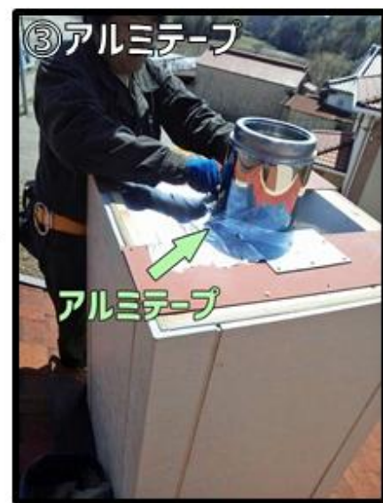
③アルミテープを貼ります。