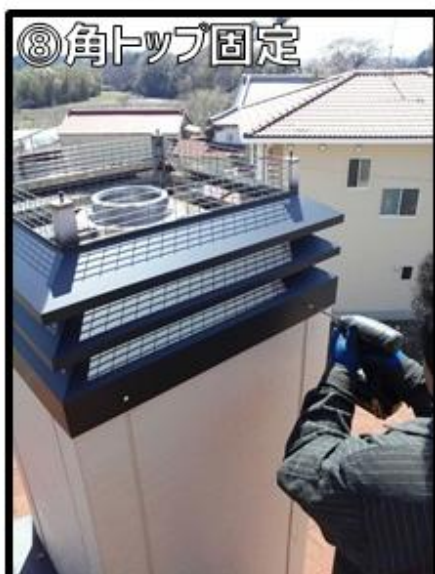
⑧角トップを固定します。