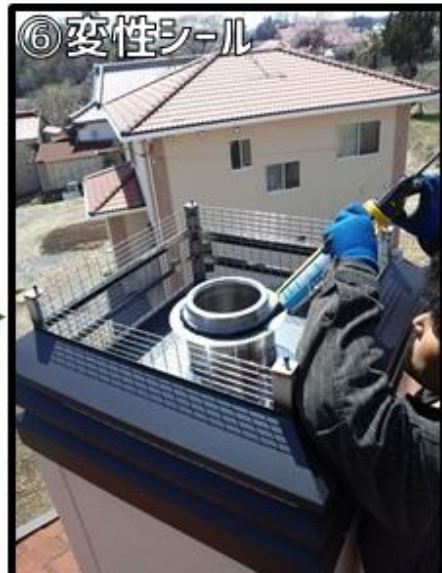
⑥変性シールをします。