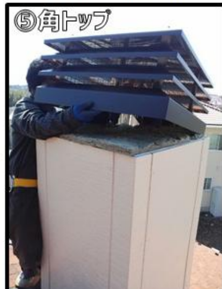
⑤角トップを被せます。