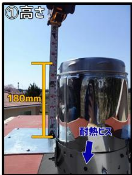
①トップの高さを180mmにします。